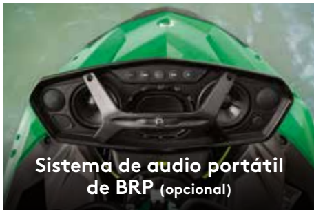
Sistema de audio portátil de BRP (opcional)

Sistema de sonido portátil Bluetooth † de 50 vatios de alta calidad y estanco.