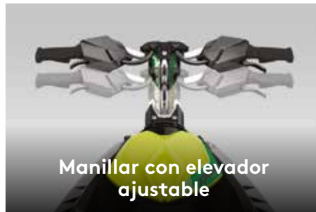
Manillar con elevador ajustable

Sistema de sonido portátil Bluetooth † de 50 vatios de alta calidad y estanco.