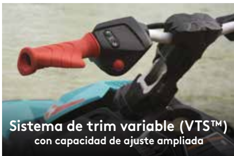
Sistema de trim variable (VTS™) con capacidad de ajuste ampliada

Proporciona mayor estabilidad y confianza en distintas posiciones de pilotaje y facilita las acrobacias de arranque como un profesional.