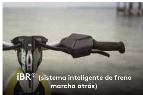
iBR® (sistema inteligente de freno marcha atrás)

Ofrece el doble de capacidad que el VTS™ normal para facilitar y exagerar las acrobacias.