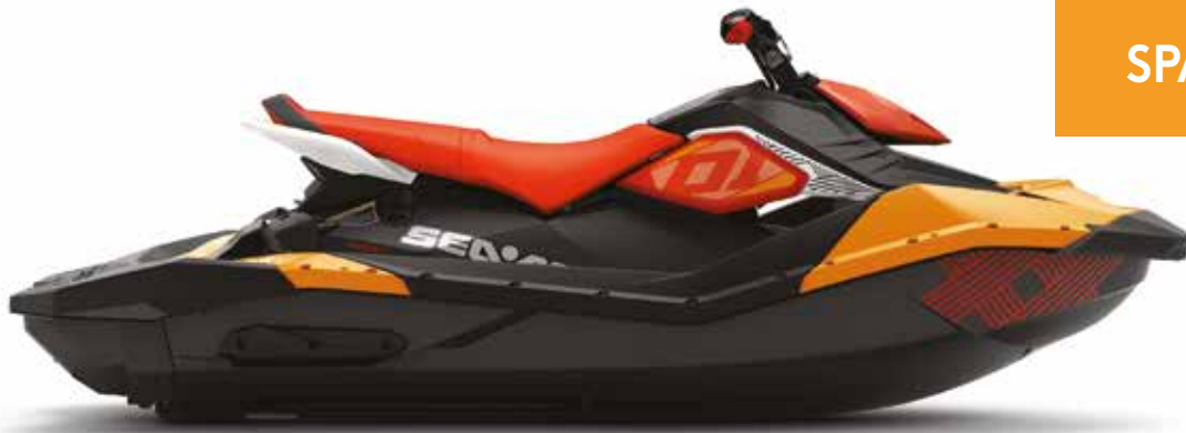
SPARK TRIXX TRIPLAZA