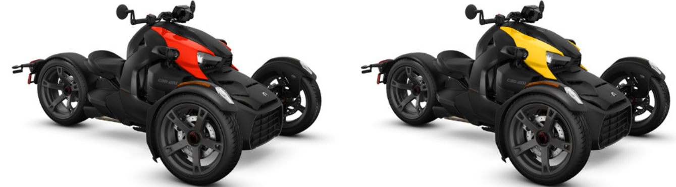
Unidades mostradas con kits de paneles Classic Series.

*Solo en la opción de motor Rotax 900 ACE