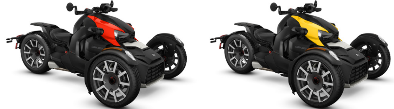
Unidades mostradas con kits de paneles Classic Series.